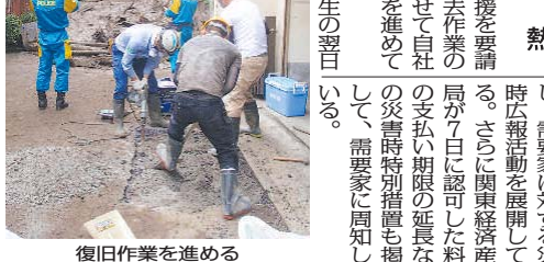
復旧作業を進める熱海ガス社員

熱海ガスは3日、静岡に進めた結果、9日午後4時時点の供給停止中の需給調整区域(熱海)の二次被害防止を目的に、伊豆半島の山地区と海光町の一部地域(約1,000戸)の都市ガス供給を停止した。これは、土砂災害の二次被害防止を目的に、伊豆半島の山地区と海光町の一部地域(約1,000戸)の都市ガス供給を停止した。これは、土砂災害の二次被害防止を目的に、伊豆半島の山地区と海光町の一部地域(約1,000戸)の都市ガス供給を停止した。