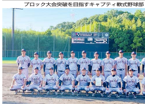
ブロック大会突破を目指すキャプティ軟式野球部

月以降は導入状況に応じて遠隔検針の対象地域を拡大していく方針だ。東京ガスは2030年度前半のスマメド導入率を50%以上とする。また、東ガスは7日、法人向け太陽光発電オンラインサービスを開始した。名目建設名簿に発電出力約13MWの太陽光発電設備を設置し、10年間、発電した電気を同支店に供給する。