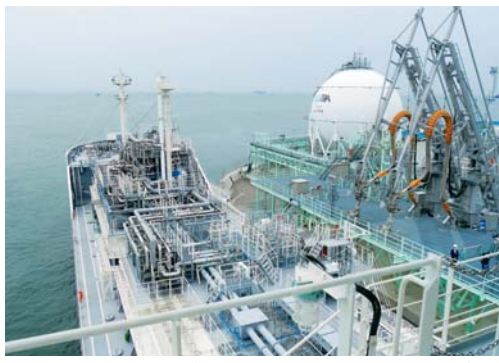
液化水素運搬船(手前)と荷役実証ターミナル(写真奥)

東京ガスは、通信機能付きマイコンメーター(スマメド)を導入し、6月から一部地域で検針を開始する。スマメドは、検針業務の効率化や通信機能などを検証する。遠隔検針は東京・大田区の約1万件を皮切りに、8月からは東京・足立区、葛飾区、北区、文京区、多摩市、武蔵野市、東大和市、横浜市緑区、同市西区、川崎市高津区、神奈川県茅ヶ崎市の約7万件で実施する。10月からは、東京・品川区、新宿区、練馬区、調布市、江東区、千代田市の約8万