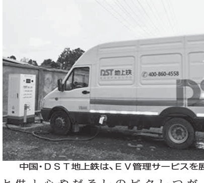
中国・DST地上鉄は、EV管理サービスを展開する

「毎日頭を悩ませる」のが、脱炭素に向けた取り組み。東京ガスは、この需要に応えるため、ハウスクリーニングサービスを開始した。提携先企業のスタッフを自社研修施設で独自に教育し、品質の高いサービスを提供する。幅広いメニューとスマートフォンで予約から決済まで完了する手軽さを売りに、東京近郊の共働き世帯をターゲットとして2025年度には13億円の売り上げを目指す。