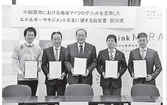
小田原市における地域マイクログリッドを活用したエネルギー管理事業に関する協定書 調印式

「毎日頭を悩ませる」のが、脱炭素に向けた取り組み。東京ガスは、この需要に応えるため、ハウスクリーニングサービスを開始した。提携先企業のスタッフを自社研修施設で独自に教育し、品質の高いサービスを提供する。幅広いメニューとスマートフォンで予約から決済まで完了する手軽さを売りに、東京近郊の共働き世帯をターゲットとして2025年度には13億円の売り上げを目指す。