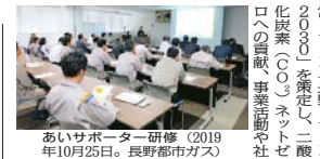
あいサポーター研修 (2019年10月25日。長野都市ガス)

鶴沼宿は中山道89宿のうち、江戸から数えて52番目の宿場町です。景観重要建造物の保存改修や水路の復元などが行われ、往時をしのばせる町並みが再生されています。宿場町を流れる大安寺川に架かる橋には、常夜灯を模したガス燈も設置。道標に記されたとおり、51番目の太田宿から二里八丁(約9km)の距離にあります。