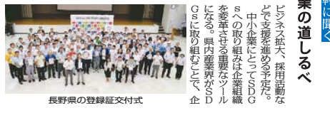
長野県の登録証交付式