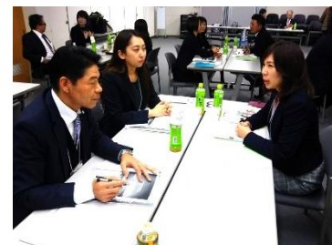
それぞれの立場で活発な意見交換